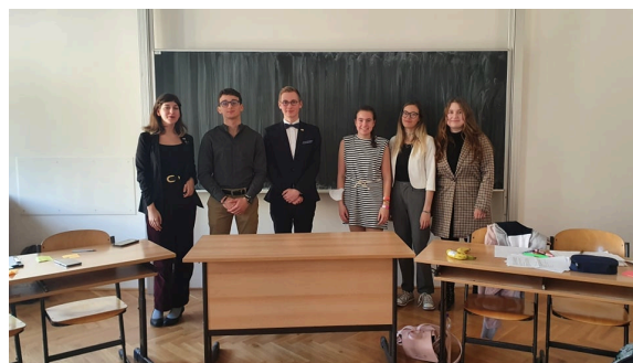
Debatéři bývají na turnajích oblečení například takto.

Oficiální normou pro oblékání na debatních turnajích je smart casual nebo business. Obojí je možné představit si jako oblečení vhodné právě pro vystoupení na půdě politického orgánu, do divadla nebo třeba na předávání vysvědčení.