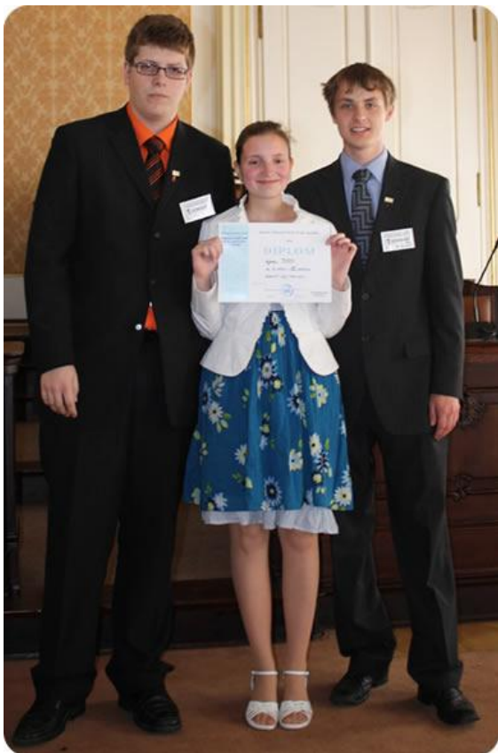
„TOGO“ Gymnázium Nymburk