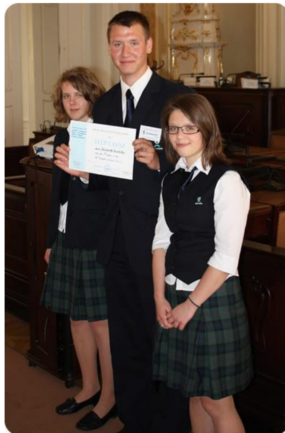
„Důdovské kombíčko“ OPEN GATE – gymnázium a základní škola s.r.o.