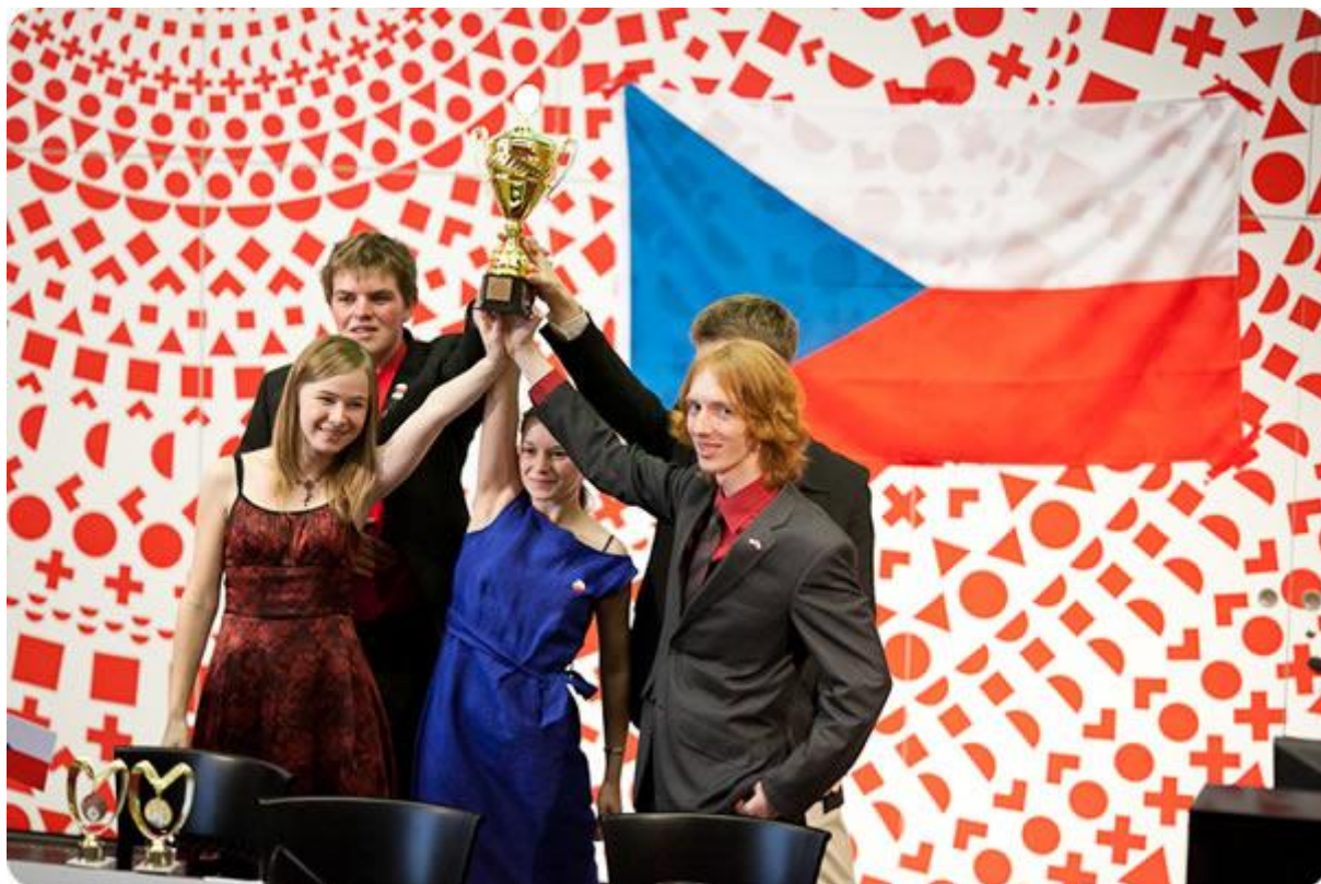
Národní tým ČR