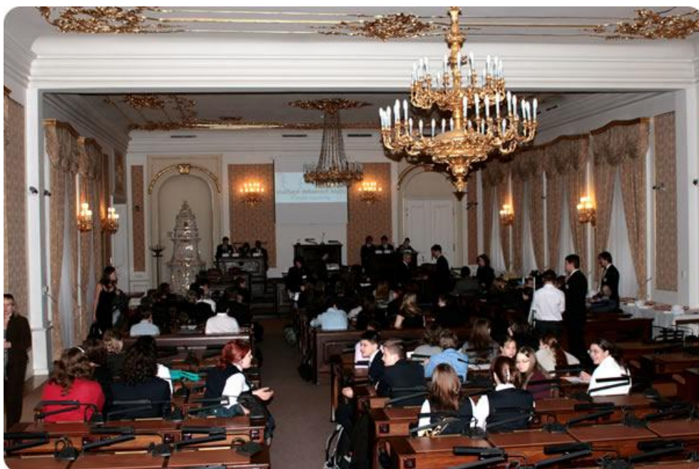
Finále soutěže Debatní liga a Debate League opět hostila PS Parlamentu ČR.